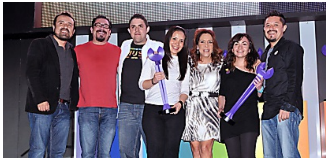
El trabajo de Oveja Negra Lowe le mereció premio en la categoría Salud e Higiene Personal.

La alta directiva aprecia que este mercado es de lo más competido y muy profesional. Esto, continuó, permite que Televisa Radio pueda destacarse con marcas globales y con contenido a la altura de lo que el mercado espera.