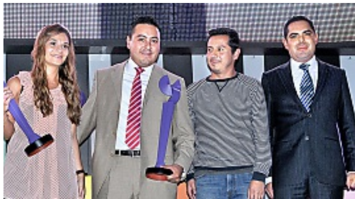
Young & Rubicam fue la agencia que más "Ángeles" ganó en esta edición, con tres en total.