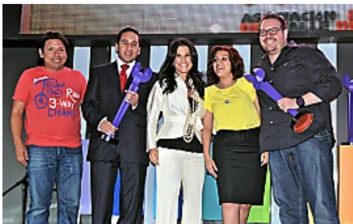
Clemente Cámara y Asociados se llevó El Ángel en la categoría Financieras y Aseguradoras.