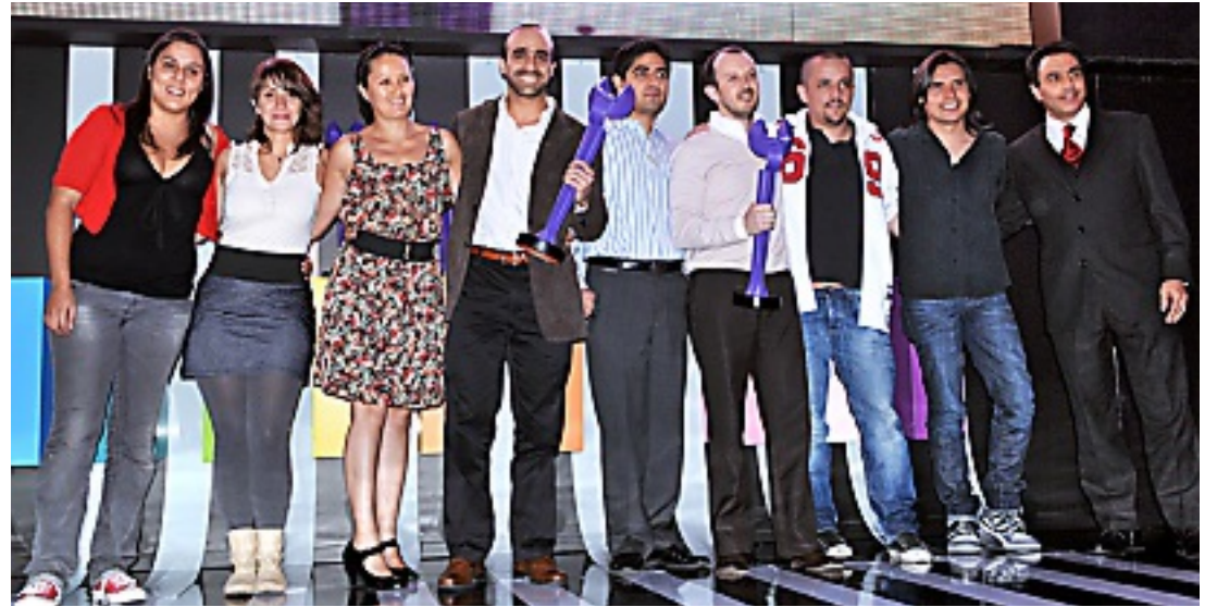
Terán\TBWA alzó un Ángel en la categoría de Turismo.