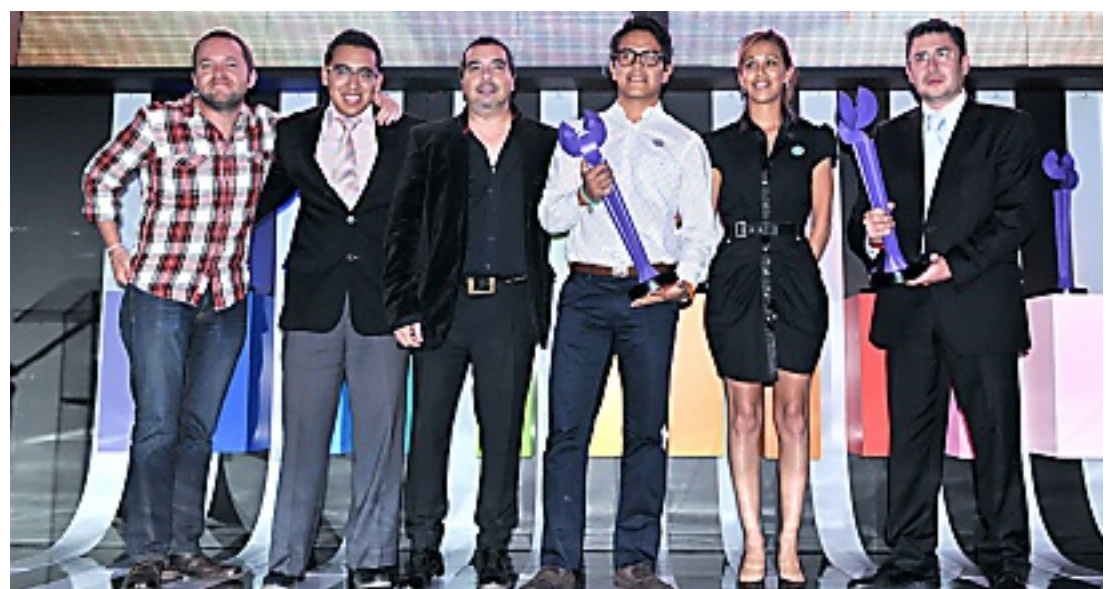
Alimentos fue la categoría en la que ganó Draftfeb.